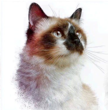
Birman Sacro di Birmania