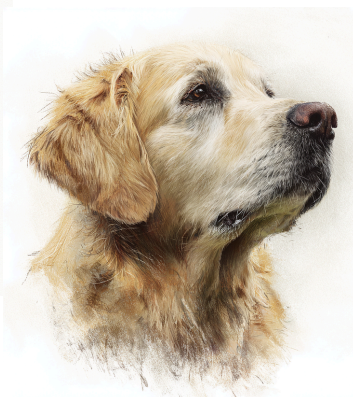
LABRADOR E GOLDEN

Valutazione cardiologica all'insorgenza di un soffio cardiaco