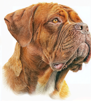
DOGUE DE BORDEAUX

Screening in giovane età per cardiopatie congenite e in età adulta per cardiopatie acquisite