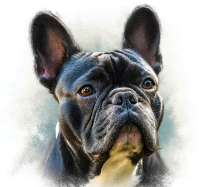
BOULEDOGUE FRANCESE BULLDOG INGLESE

Screening in giovane età per cardiopatie congenite e dai 4 anni Ecocardio + Holter