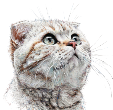
British Shortair Scottish Fold

(+test genetico mutazione ALMS1) e nuove razze incrociate con lui