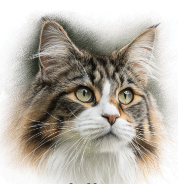
Gatto delle Foreste Norvegesi